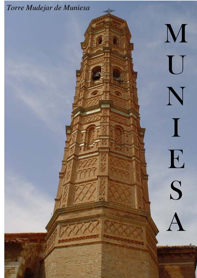
Torre Mudejar de Muniesa