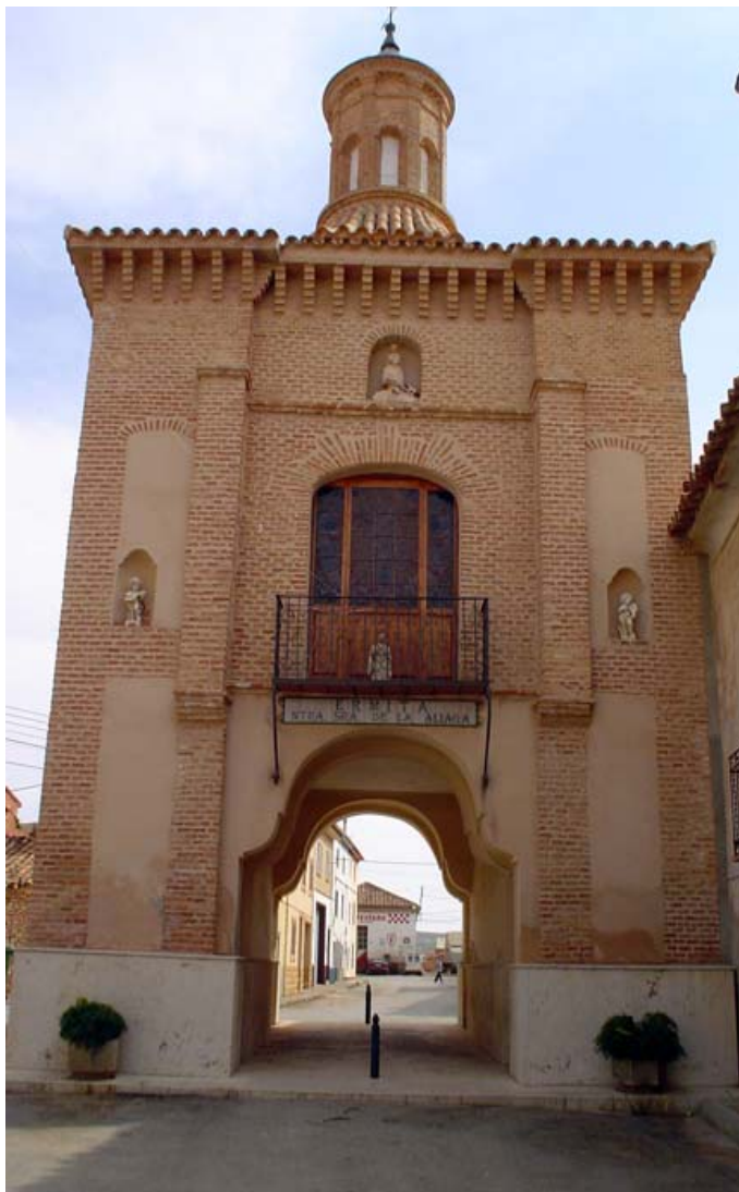
Ermita Virgen de Aliaga de Muniesa

PARA EL DISFRUTE DE TODOS LOS VECINOS DE LA COMARCA Y DEMÁS PERSONAS QUE QUIERAN ACOMPAÑARNOS.