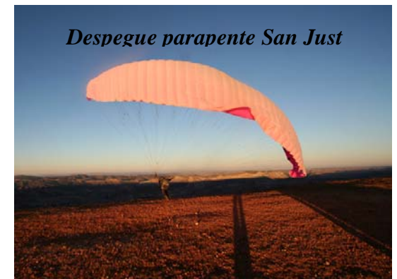
Despegue parapente San Just